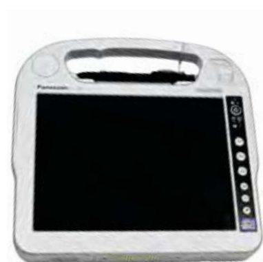
手持式平板控制器

所有实时记录在控制器中的数据都可以立即预览并做数据完整性分析。无需回到内业检查遗漏。不使用控制器I-Site 8810也可独立完成360度数据采集并直接将数据存储到扫描仪USB端口的外接设备中。